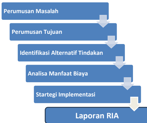
Gambar 14.2: Konsultasi Stakeholders Tahapan Regulatory Impact Assessment (RIA)

Konsultasi publik dilakukan pada setiap tahapan melalui diskusi dengan stakeholder dan menyebarkan rancangan laporan RIA kepada masyarakat. Ketujuh tahapan RIA ini dapat digambarkan dalam diagram berikut: